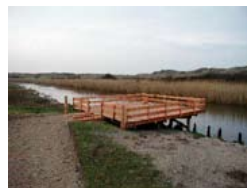
Fiskeplads ved Uggerby Å.

Ovenstående søgninger viser samtlige handicapegnede fiskepladser i hele landet. Vil du kun se for dit eget område, kan du lave din egen søgning i www.friluftskortet.dk .