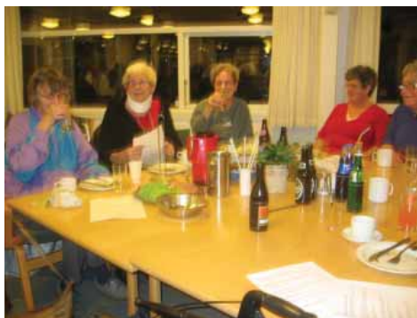
Billeder fra generalforsamlingen i Aalborg Gruppen.