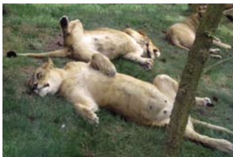
Stemmingsbilleder fra Givskud.