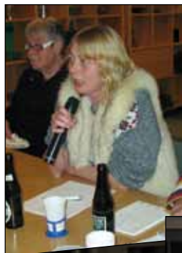
Generalforsamling 2010